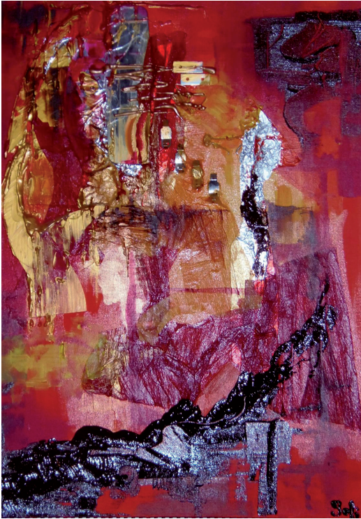
La Vierge et le Pharaon 50 x 65cm