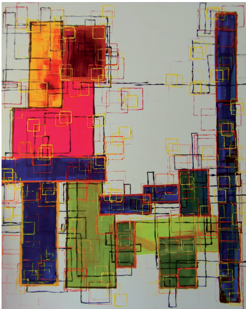
Paysage urbain 80 x 100cm

À regarder l'œuvre de Sofi, trois expressions s'imposent immédiatement à l'esprit : le rythme, la force des couleurs, l'essentiel exprimé. L'artiste va droit au but, parfois dans une expression presque minimaliste, parfois dans une composition complexe, mais toujours de manière juste, forte, lumineuse, colorée... un brin d'humour en plus, assez souvent.