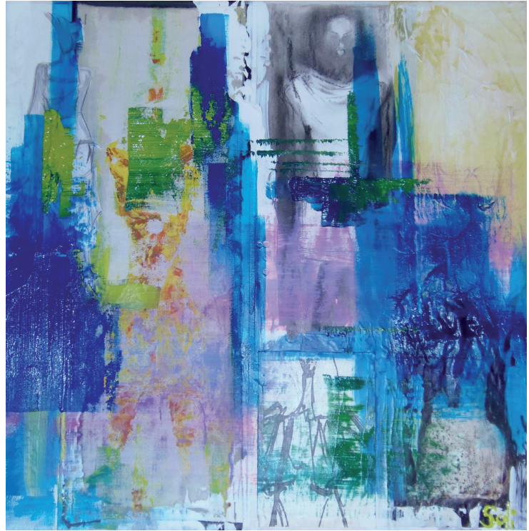
Du corps à .... 50 x 50cm