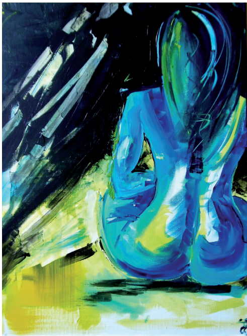
Dans la lumière de la nuit 60 x 80cm