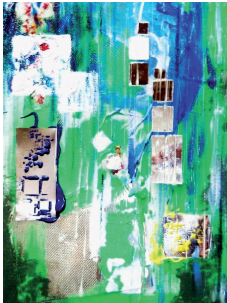
Pluie d'I vert 30 x 40cm